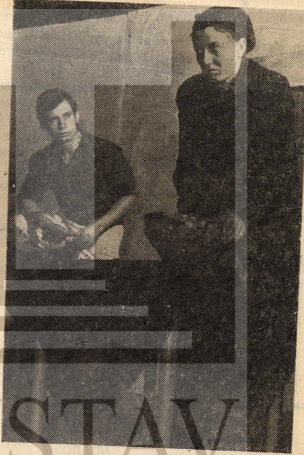
“Carrar Ana'nın Silâhları” adlı oyundan ilginç bir sahne